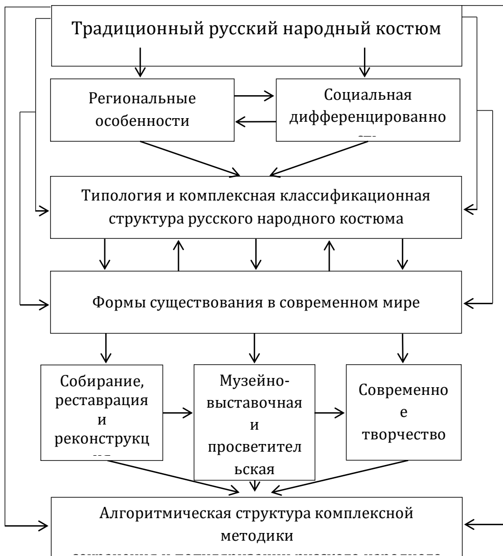
Рис. 1. Блок-схема диссертационного исследования

культурами. От периода Древней Руси до начала XVIII века народный костюм практически не менялся. В результате широких преобразований в России, осуществляемых Петром 1 и затронувших все стороны жизни, в XVIII веке русский костюм претерпел изменения в стиле западноевропейской моды, касающиеся только привилегированных сословий. Русский народный костюм сохранился в основных чертах в крестьянской среде вплоть до начала XX века. Его характерной чертой является региональная вариативность в рамках общерусской национальной традиции.