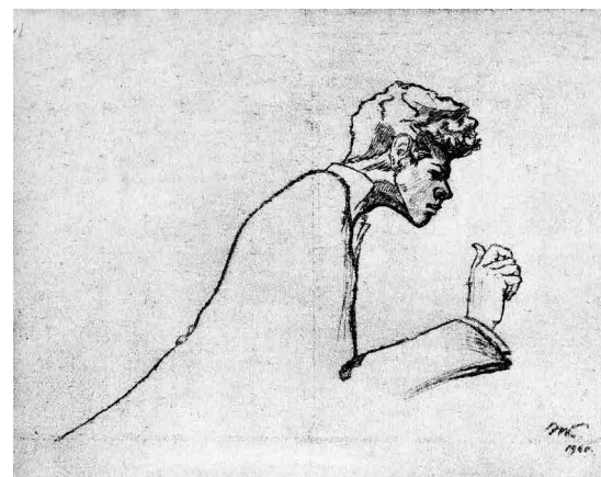
Рис. 16. И.Г. Кадина. Ван Клиберн. Аппассионата. Грав. 1958 г.