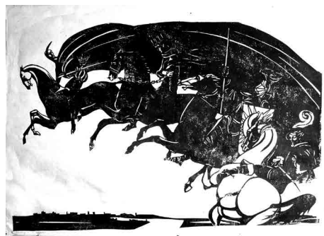
Рис. 18. И.Г. Кадина. Мастер и Маргарита. Встреча Мастера и Маргариты. Рис. 1969 г.