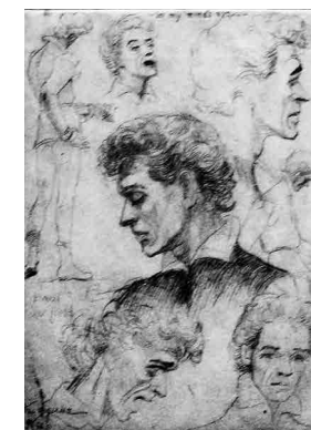
Рис. 13. И.Г. Кадина. Дирижер Мелик-Пашаев. Х., м. 120 x 70. 1965 г.