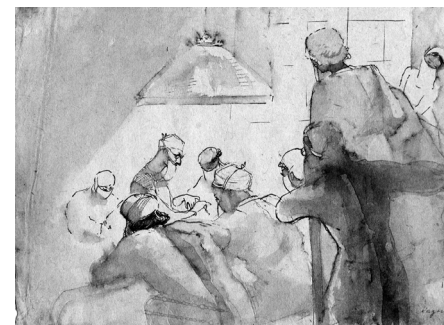
Рис. 6. И.Г. Кадина. Операция С.С. Юдина. Рис. 1941 г.

«...Когда сели ужинать, позвонила по телефону Наташа и сказала, что архитектурный эвакуируется в Ташкент. Маршрут: до Ярославля пешком, а оттуда эшелонам. Завтра в 6 утра сбор в походном порядке. Кто не явится, отчислят.