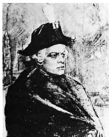
Рис. 10. И.Г. Кадина. Лемешев — Герман. Грав. 1963 г.