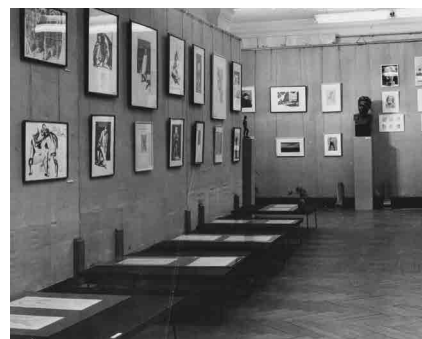
Рис. 23. Работы И.Г. Кадиной на выставке кафедр рисунка 1969 г.