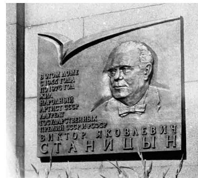
Рис. 20. Мемориальная доска актеру Станицыну. Арх. И.Г. Кадина. Ск. Г.Д. Жилкин