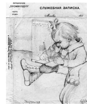
Рис. 3. Г.П. Кадин. Творчество. Рис. 1923 г.