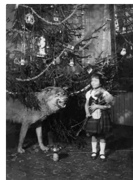
Рис. 2. Ира и знаменитый волк. 20-е гг.