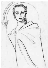
Рис. 9. И.Г. Кадина. Уланова — Джульетта. Грав. 1958 г.