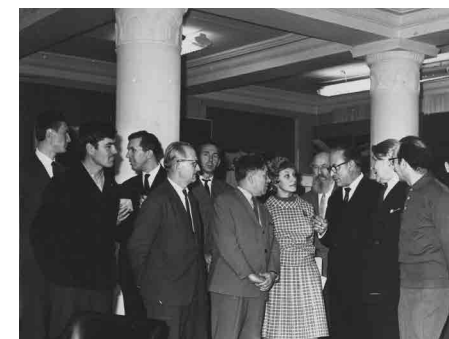
Рис. 24. Н.А.Бенуа в Строгановском училище. 1965 г.

И вот в Москву приезжает английский театр и привозит Гамлета. «Я, наконец, дождалась, ведь в Москве тогда Гамлет не шел. Появление Пола Скофилда, его нервная игра, облик, голос необычайной силы и глубины — все меня потрясло. На спектакле я делала лихорадочные наброски в полной темноте, карандаш летел на пол, полевой бинокль мешал, томик Шекспира сваливался под кресло... Меня точно оглушили. Шла пешком домой, держа в памяти то одну, то другую сцену» [3].