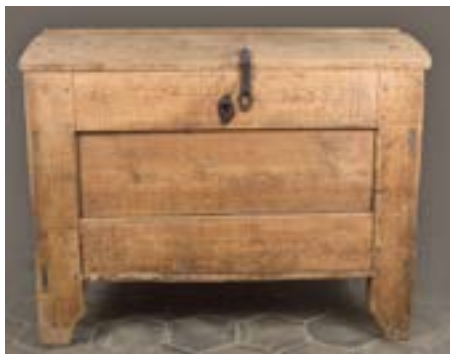
Рис. 3. Ларь. Новгородская губерния (Маревский район), начало XX века (НГОМЗ, инв. № НГМ КП-36241/34, ДЭ-5825)

Ларь имеет большие размеры: 98,5 x 116,5 x 68 см. Конструкция его проста (11). Предмет состоит из четырех плоских ножек, стесанных снизу, в пазах которых укреплены стенки (каждая из них составлена из трех досок). Как на большинстве подобных изделий, средняя доска отличается по размерам от остальных: она шире их и образует филенку. Это несколько смягчает монументальный, суровый внешний облик изделия. Боковые стенки и оборотная сторона собраны иначе. Во-первых, на них нет филенки, во-вторых, средняя доска не шире, а уже двух других. Эти стенки представляют гладкие поверхности. На оборотной стороне, слева, расположено отверстие. Возможно, оно имеет практическое назначение, если учитывать функцию ларя как хранилища муки. Приголовок располагается справа. Дно собрано из нескольких досок, закрепленных в опорных столбах. Крышка — покатая. Она поднимается и опускается с помощью деревянных шарниров. Три доски, из которых состоит крышка, скреплены деревянными досками в виде дуг, прибитых шпонками с внутренней стороны крышки. С внешней стороны к крышке прикреплена узкая деревянная доска. Это придает четкость форме изделия и одновременно усиливает его конструкцию. Для дополнительного укрепления также использованы деревянные шпонки.