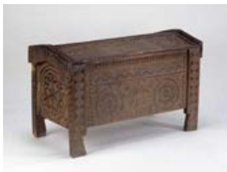
Рис. 2. Скриня. Село Яворов, Косовский р-н, Ивано-Франковская обл. (Украина), конец XIX века (Национальный музей украинского народного декоративного искусства, г. Киев)

Обзор истории «саркофаговых» сундуков можно было бы продолжить. Необходимо отметить, что в Европе они были распространены