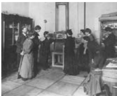
Рисунок 1. Эмальерная мастерская Императорского Строгановского училища.